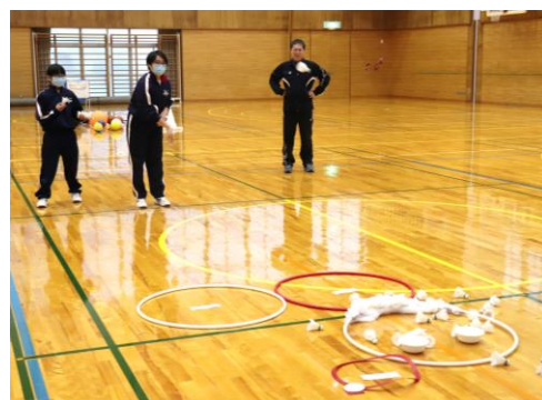
サンタチャレンジの様子

コロナ禍により例年どおりの活動が制限される中、生徒たちは生徒会テーマ「挑戦」のもと、新しい活動にチャレンジしています。たとえば、執行委員会が企画して12月15日に行われた「スポーツフェスティバル」です。生徒、教員混合で2チームに分かれ、演技走（ピンポン玉運びやフープ跳び等の障害をクリアする）とサンタチャレンジ（フープを的に見立て、シャトルを投げて点数を競う）の2つの競技をしました。一人一人が自分の役割を果たすことで、生徒会活動、委員会活動等が充実していると感じています。