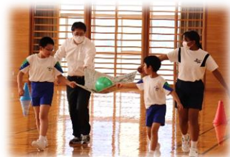
中学2年企画 「心はつないで！ソーシャルディスタンスリレー」

小中学生の仲を深めることや各学級の企画力を高めることを目的として、「小中ふれあいの日」を設けています。3密にならないよう工夫しながら活動を行いました。