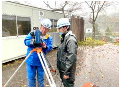
米澤工業株式会社

11月2日、「社会に学ぶ『14歳の挑戦』」を行いました。事業所のみなさまには、大変丁寧にご指導くださり、生徒たちは仕事の大変さややりがい、働くことの意義や、社会人として大切なこと等を学ぶことができました。本当にありがとうございました。