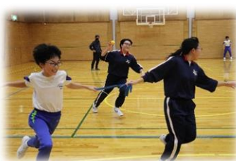
中学1年企画 「ソーシャルディスタンスおにごっこ」