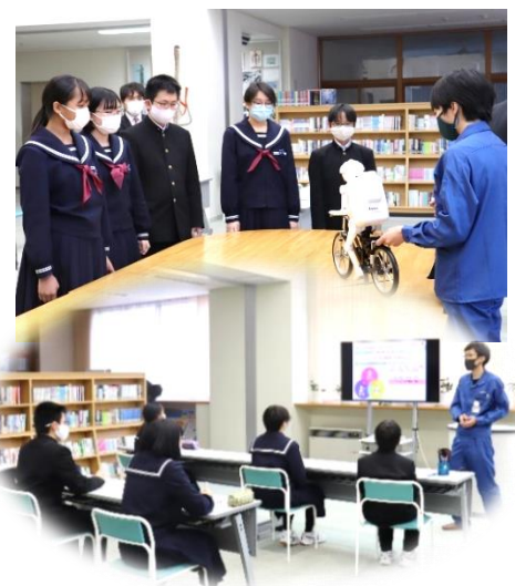
「ものづくり講演会」の様子