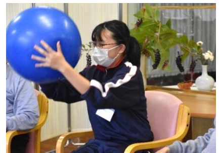
利賀高齢者生活福祉センター「ネイトピア喜楽」