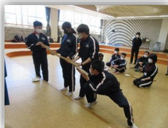
立山遊びリンピック