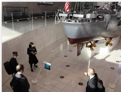
1/10 スケール戦艦大和を見学

平和記念公園や大和ミュージアムで戦争について学び、平和について自分たちにできることを考えました。また、厳島神社や姫路城を見学し、日本が誇る文化遺産に触れる貴重な経験になりました。