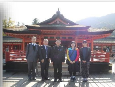
厳島神社の前で集合写真