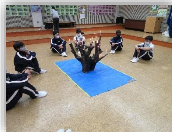
キャンドルサービス